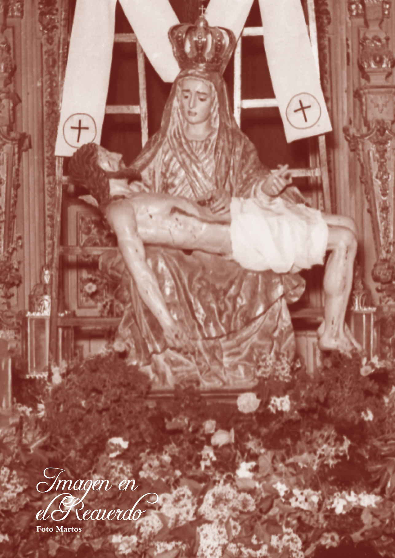
Imagen en el Recuerdo